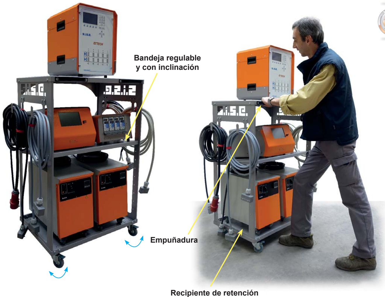
Soporte de los cables